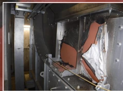
焼け焦げたコンベア②

リチウムイオン電池混入により、破砕機内にて火災が発生しました。消火及び修復作業で、復旧まで2日間粗大処理施設が停止しました。