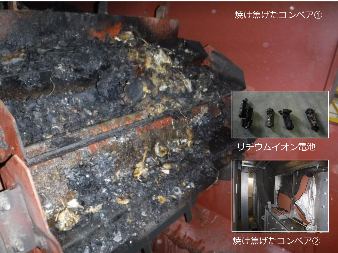
焼け焦げたコンベア①